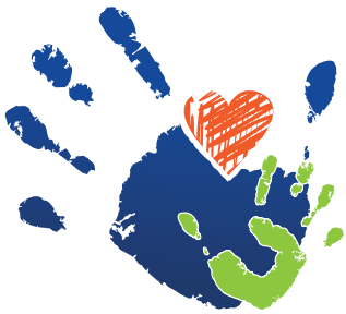
Table des partenaires Petite Enfance - Famille 0 - 5 ans de la MRC d'Acton