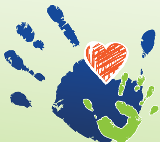
Table des partenaires Petite Enfance - Famille 0 - 5 ans de la MRC d'Acton